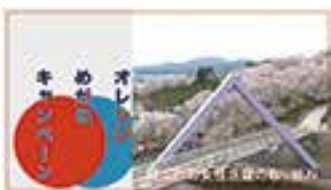
「鯖江市の女性活躍の取り組み」