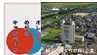
「鯖江市の女性が輝く企業」